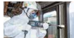
◀アスベスト除去作業の様子