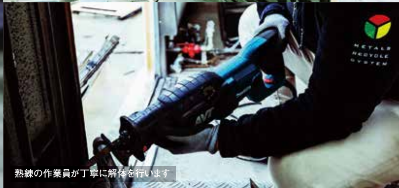
熟練の作業員が丁寧に解体を行います