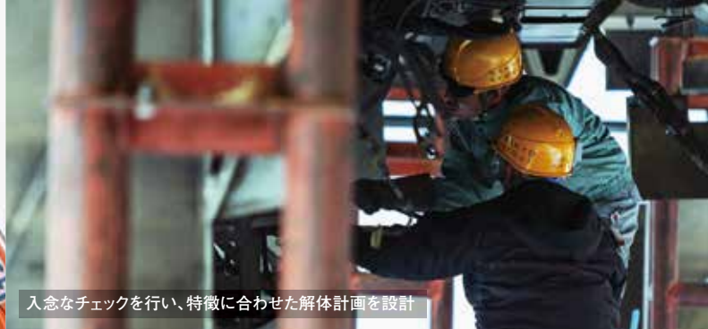
入念なチェックを行い、特徴に合わせた解体計画を設計