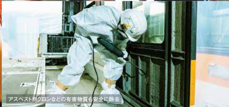
アスベストやクロロなどの有害物質も安全に除去